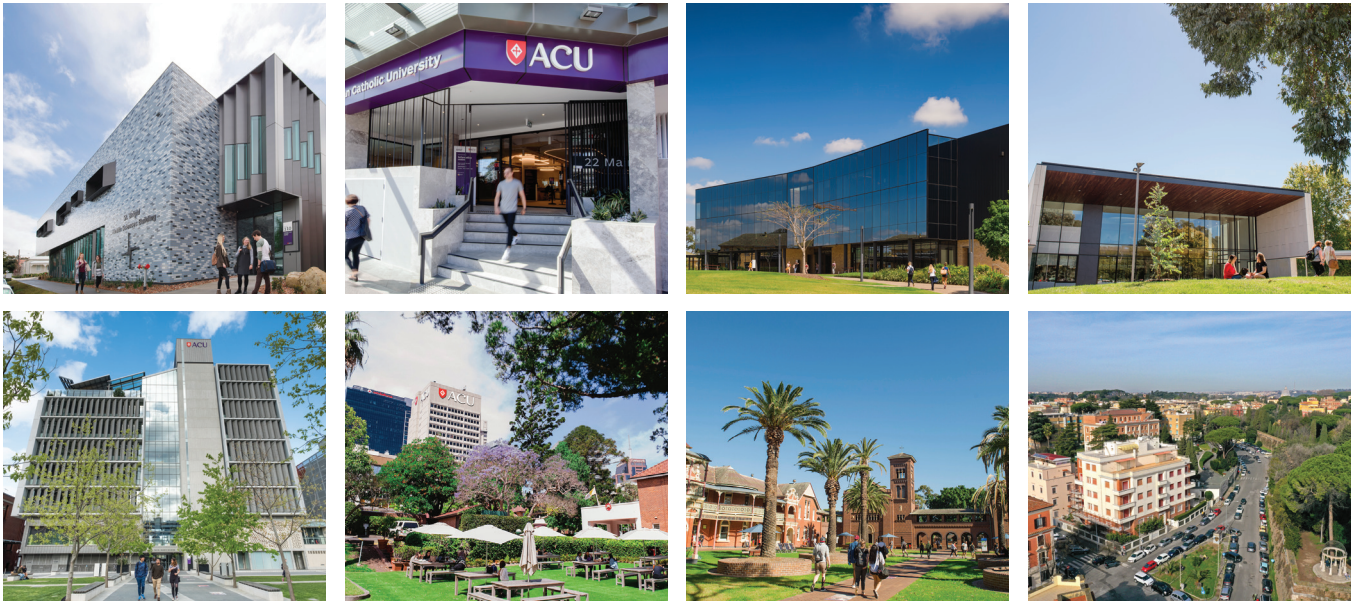
(由左至右) 巴拉瑞特校区、悉尼布莱克敦校区、布里斯班校区、堪培拉校区、墨尔本校区、北悉尼校区、悉尼史卓菲校区、意大利罗马校区。